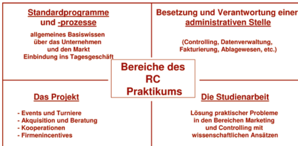
ABBILDUNG 3: Die Aufgabenbereiche eines Praktikanten (Sektorengliederung des RC-Praktikantenkonzepts)

Dass am „anderen Ende eines Geschäftsvorfalles“ eine Transparenz vorliegen muss, die den Verantwortungsträgern eine Steuerung der geschäftlichen Gegenwart in eine wirtschaftlich erfolgreiche Zukunft ermöglicht, ist eine Frage der Qualität in den administrativen Abläufen. Hier ist eine Sorgfalt gefragt, die man nur dadurch erfahren kann, dass man in die Administrationskette eingebunden wird und Aufgaben im Controlling, in Leistungsdokumentationen, Abrechnungen oder im ganz einfachen Ablagewesen gewissenhaft wahrnimmt.